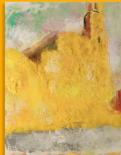
Mur jaune, 1988 Huile sur bois Non signé, non daté Collection privée

« À mon goût je n'aurais peint qu'un seul tableau. Il serait une synthèse du jour et de la nuit, le paysage des tropiques [...], l'hiver et l'été, l'automne et le printemps. Un paysage total, unique, qui comprendrait et définirait à lui seul toute la vie, le monde entier. »