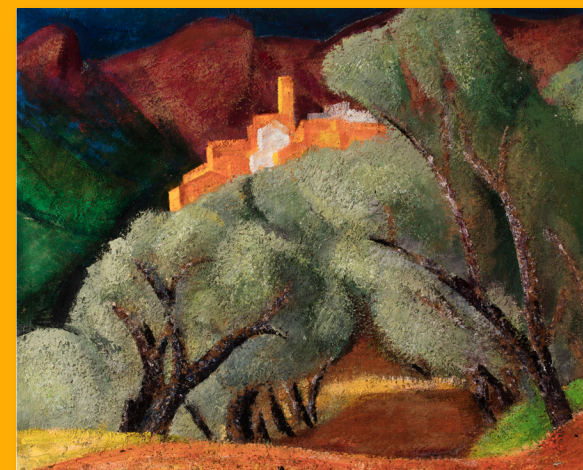
La Pobla de Segur Huile sur toile Signé et daté au verso : «Miquel Villà / Pobla de Segur 1978» Collection privée

« Ce qu'il y a dans un tableau se forme petit à petit, au fur et à mesure de notre vie, au fil des ans, des siècles, avec tous les sédiments de l'histoire. Ceux qui peignent vite n'obtiennent quelque résultat que par chance, par pur hasard. »