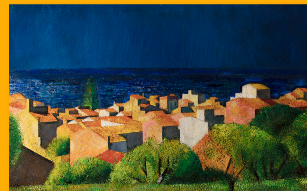
El Masnou Huile sur toile Signé et daté au verso : «Miquel Villà / Masnou 1951-61» Collection privée

« Le mieux est de rester à un même endroit et avec les mêmes sujets. La relation entre deux ou trois formes, l'harmonie entre deux ou trois couleurs sont suffisantes pour approfondir nos études de la nature au cours de toute une vie. »