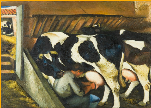
Étable (El Masnou) Huile sur toile Signé et daté au verso : «M. Villà / 1936» MNAC-Museu Nacional d'Art de Catalunya, Barcelone

« Face à la nature je cherche à mettre de l'ordre dans ce chaos et le réduire à des formes et des couleurs primaires. »