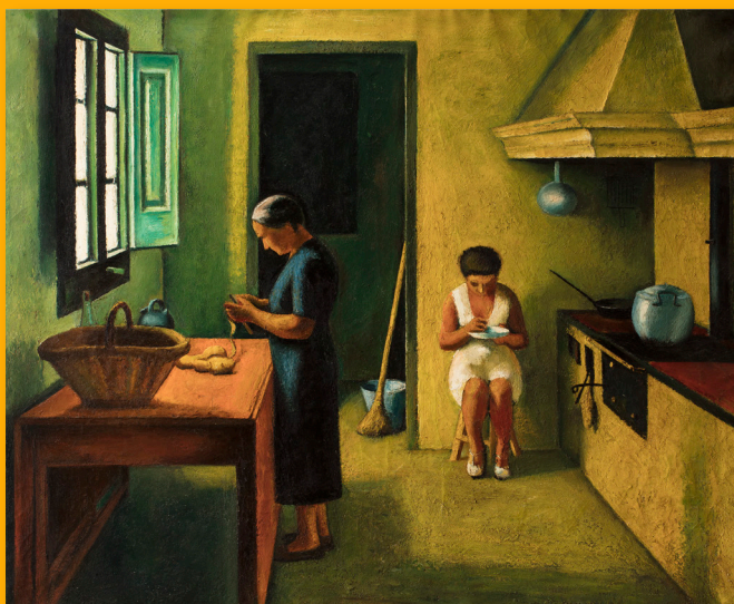
La Cuisine , c. 1939 Huile sur toile Non signé, non daté Collection privée

« La peinture est un travail lent ; il se fait lentement, et c'est aussi lentement que l'esprit du spectateur y parvient. »