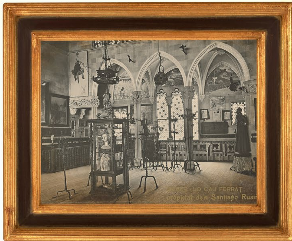
Vista parcial del Gran Saló del Cau Ferrat, on Santiago Rusiñol exhibia la major part de la seva col·lecció, c. 1897-1902