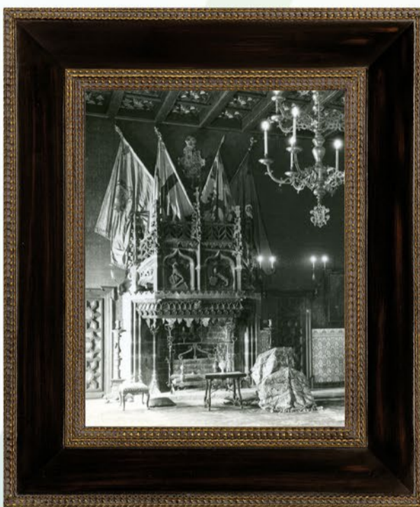
Sala de Festes de Maricel presidida per una monumental xemeneia procedent de Jaca, 1918