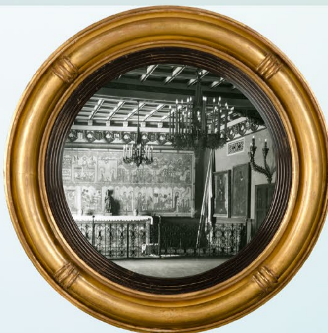
Sala dels Retaules de Maricel, 1918