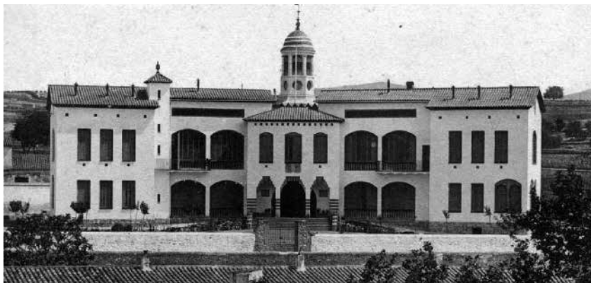
7. Targeta postal Hospital de San Juan, (1912).