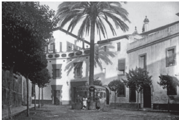
25. Façana sudoest del Palau de Maricel, amb entrada al garatge i dependències de servei per la Plaça de l'Ajuntament (1919-1921).