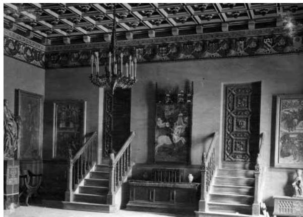
75. Sala dels Retaules, amb les portes comunicants amb el Gran Saló. Enmig, el retaula de Sant Jordi i el drac , de Bernat Martorell. (1918).

El 1917, tot just enllestida, Utrillo hi traslladà la totalitat dels retaules que, fins al moment, es trobaven dispersos entre la residència de Deering i les dependències del Palau. Va ser la sala més espectacular de Maricel, més encara que el Gran Saló (Saló d'Or). La comunicació entre els dos cossos del Palau de Maricel s'efectuava per les escales simètriques que hi ha a banda i banda del frontal de la sala. Enmig hi figurava, sol, el retaula de Sant Jordi i el drac , de Bernat Martorell (segle xv) i la paret d'enfront l'ocupava, sencer, el frontal i el retaula de Quejana. Les parets laterals estaven cobertes de taules i retaules, principalment gòtics.