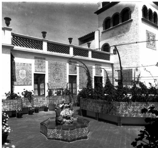
82. Terrassa lateral, corresponent a la casa de Miquel Utrillo. Foto F. Serra (1918).

A la terrassa central, sobre el Saló d'Or, destaquen diversos plafons de rajoles de ceràmica portuguesa del segle XVII. En aquesta terrassa s'hi van incorporar fonts i canalitzacions d'aigua per atorgar-hi un aspecte de bellesa i frescor, així com de construccions de pèrgoles en fusta per propiciar l'emparrat de les plantes. A les torretes i jardineres s'hi van plantar, respectivament, clavells i geranis. La terrassa central va ser concebuda com una imitació del Canal del Generalife, un estret corrent d'aigua amb