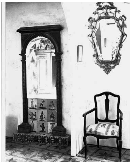
45. Lateral de l'habitació de Mrs. Deering, amb l'ampit del finestral emmarcat i decorat amb rajoles d'oficis. Foto F. Serra (1918).