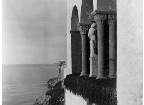
38. El sanejament del lateral de l'antiga capella que donava a mar va ser acuradament complet. (1913).

Obert a mar, quedava aïllat del menjador per vidrieres.