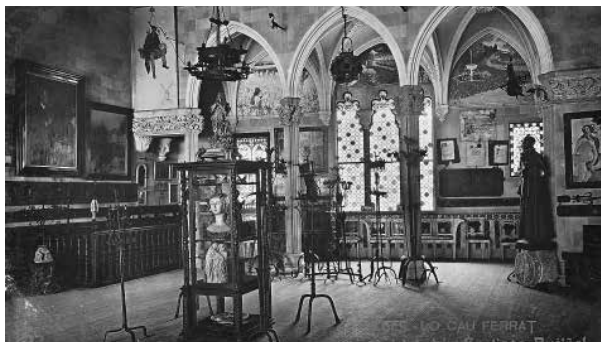
5. Targeta postal Sitges. Lo Cau Ferrat , propietat de Santiago Rusiñol. Gran Saló. Fotògraf desconegut (c. 1910).