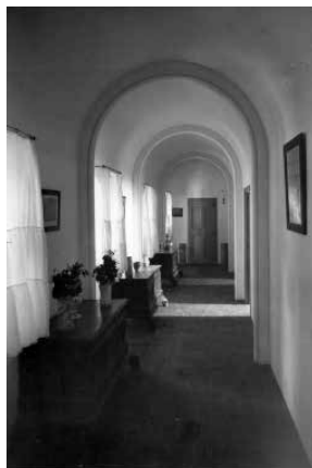
52. Passadís vers diverses cambres del segon pis de la residència Deering. Foto F. Serra (1918).