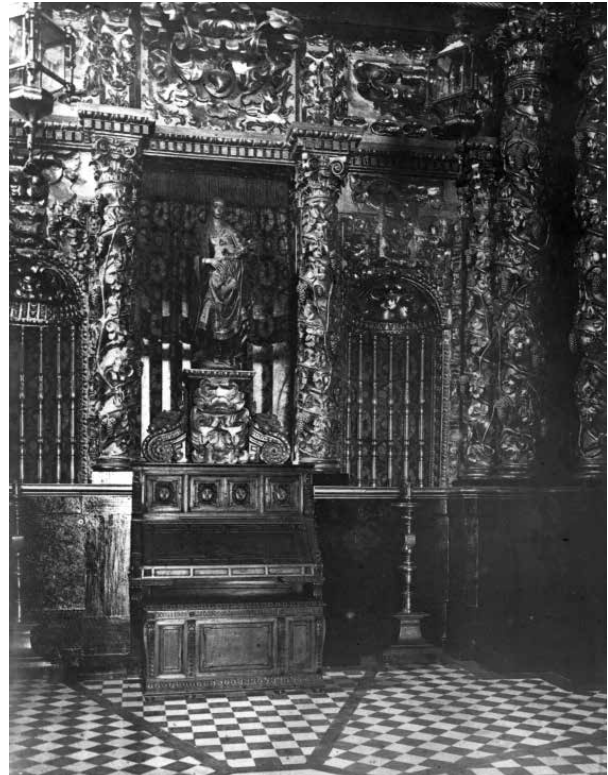
66. La Sala Capella lluint tot el seu esplendor, amb l'orgue. (c. 1919).