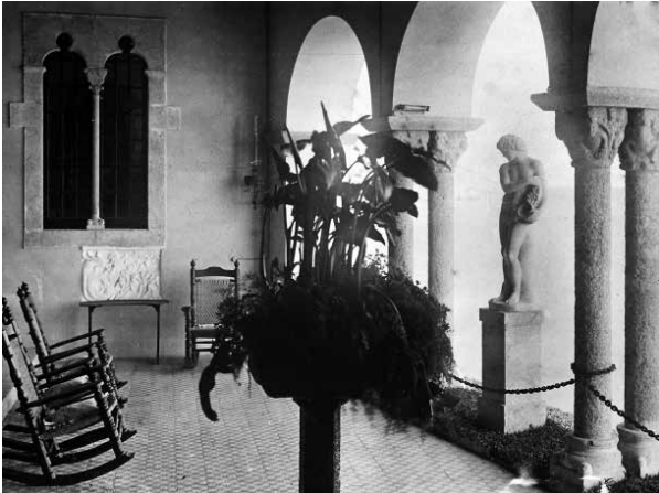
37. Abans i ara, el Mirador de Maricel ofereix la màgia de la contemplació permanent de la mar com un atractiu més. Foto A. Mas (1913).