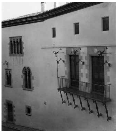
17. Can Rocamora, antiga casa Xicarrons. A la façana del costat, llueix el balcó procedent de Santa Coloma de Queralt (segle XVI) . Foto F. Serra (1918).