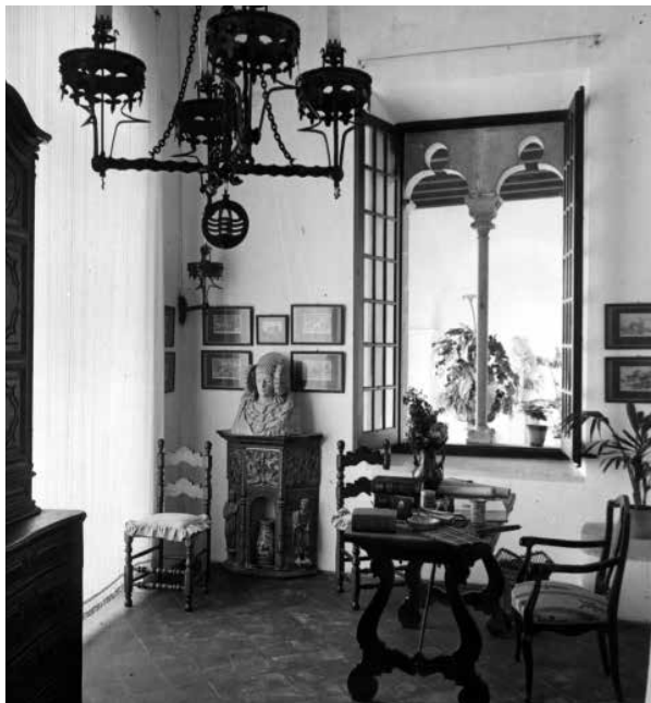
35. L'antiga sacristia de la capella de l'hospital, reconvertida en una saleta primorosament decorada. Foto A. Mas (1913).

Un espai annex a l'antiga capella (probablement, la sacristia) va esdevenir la saleta annexa al menjador gran. Un finestral gòtic convenientment situat obria la vista al Mirador.