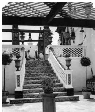
79. Escalles de la terrassa central.