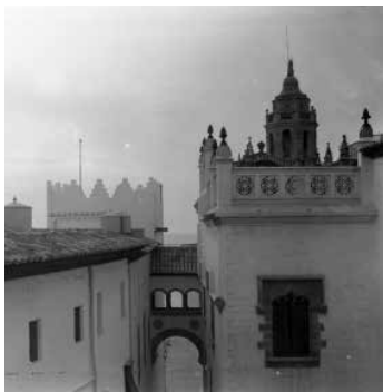
57. Vista aèria de la construcció de Maricel. Foto F. Serra (1918).

L'element més espectacular va ser el portal d'accés al Palau, amb la porta d'estil gòtic flamíger procedent de Cadalso de los Vidrios (Madrid), popularment coneguda com a Porta de Salamanca.