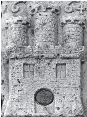
70. Escut de la Vila de Sitges datat el 1664 i situat a l'entrada de la 5a Avinguda de Maricel. Foto Josep Maria Alegre (2015).

A nivell del carrer i pel cantó del Baluard de Maricel, Utrillo va demanar llicència per embellir la façana exterior de la denominada 5a Avinguda, cobrint el frontal del Baluard de Maricel i el de la Plaça de l'Ajuntament.