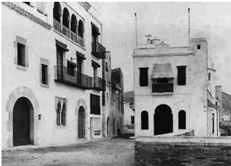
67. Les cases Trowbridge van ser reformades seguint el mateix criteri de bon gust que Maricel.