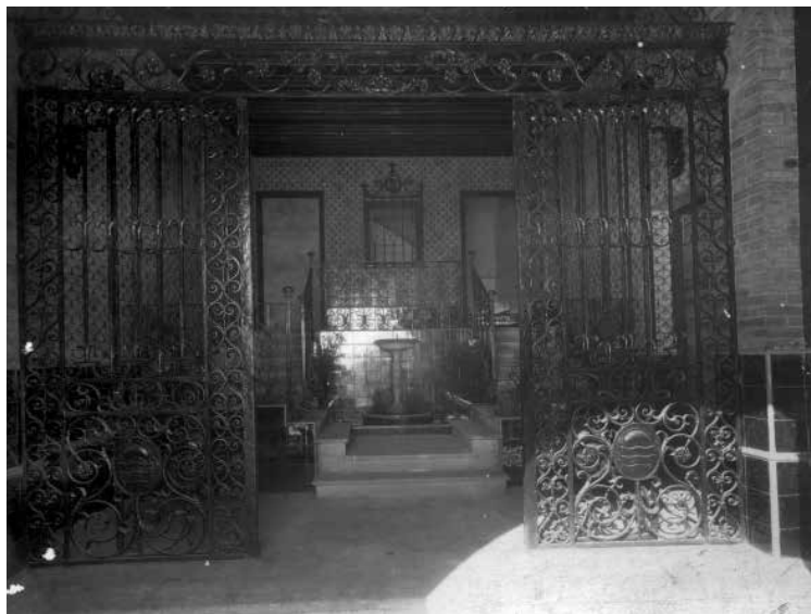
72. Vestíbul de l'entrada a Maricel pel Baluard de Santa Caterina. Foto F. Serra (1918).

Un gran reixat de ferro de dalt a baix, amb l'escut de Maricel, donava visibilitat a aquesta entrada monumental sense que fos lloc d'accés al Palau, que habitualment era per la Porta de Salamanca, al Racó de la Calma. La funció d'aquesta sala d'entrada era, doncs, principalment estètica: oberts els portals d'enfora, la reixa permetia veure-la, però no practicar-la.