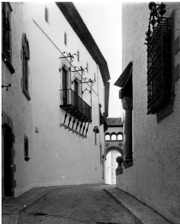
54. El pont de Maricel ha esdevingut una silueta característica des de la seva construcció. Foto F. Serra (1918).

La intencionalitat de l'arc que uneix la Residència i el Palau és de fer de lloc de pas entre tots dos edificis.