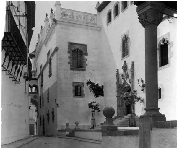
16. El Palau de Maricel edificat a la Placeta de Sant Joan i al carrer de Fonollar. Foto F. Serra (1917).