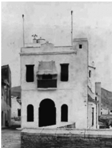
28. La primera reforma de la façana de l'antic hospital, reconvertit en la residència de Charles Deering. Targeta postal d'A(nge)l T(doldrà) V(iazo) (1912).

Charles Deering va obtenir llicència d'obres per actuar a l'interior i a la façana. Entre 1910 i 1913 la disposició de l'edifici no va variar d'estructura, aprofitant les tres plantes de què disposava. La façana va ser retocada per adquirir un aspecte més modern i harmònic. Per la porta del Baluard de Santa Caterina, actual Baluard Miquel Utrillo, Deering hi entrava el seu automòbil, i l'entrada amb rebedor era per la porta lateral.