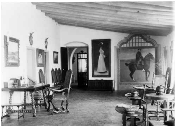
47. Estudi de Charles Deering. (1913).

L'estança, situada al primer pis de la residència de Maricel, va anar variant d'aspecte amb el temps, a mida que la decoració creixia i s'anava tornant més comfortable i luxosa.