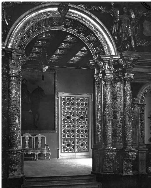
62. Vestíbul del Palau de Maricel (1915). Decorat en tons blancs i daurats, inicialment va ser presidit pel Retrat eqüestre d'Alfons XIII , de Ramon Casas (1925). Foto F. Serra (1918).

Al vestíbul s'hi van instal·lar obres de gran format: inicialment, el Retrat eqüestre d'Alfons XIII , de Ramon Casas i, posteriorment, la Al·legoria del Temps i de la Història , de Francisco de Goya. El mobiliari era del segle XVIII i les parets i l'enteixinat del sostre eren daurats i blancs, per donar lluminositat a l'estança i contrastar amb la decoració del Saló d'Or.