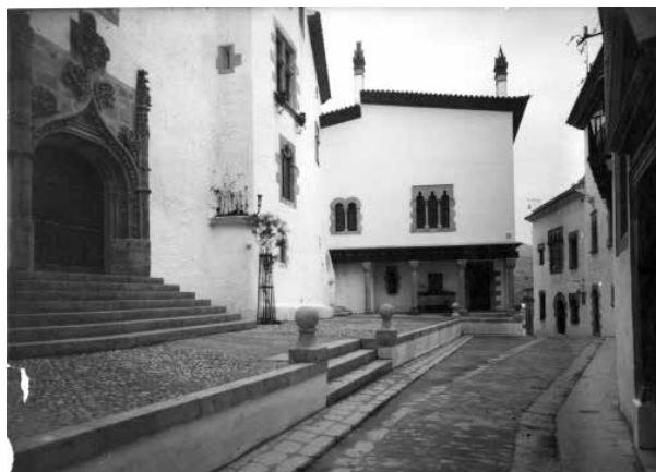
18. L'edifici del Sarcòfag tanca la construcció de la Placeta de Sant Joan. Foto F. Serra (1918).