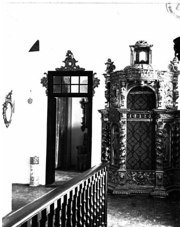
44. Distribuïdor del primer pis, cap a l'ala dreta cap a les dependències de Mrs. Deering. Foto F. Serra (1918).

A l'esquerra de la fotografia s'endevina l'escultura de Gustau Violet, L'encaminadora . Utrillo era un gran admirador, i promotor, de l'escultor rossellonès. El 1914 li va adquirir divuit escultures a l'exposició que Violet havia presentat a les galeries del Faiç Català, a Barcelona, per a la col·lecció de Deering.