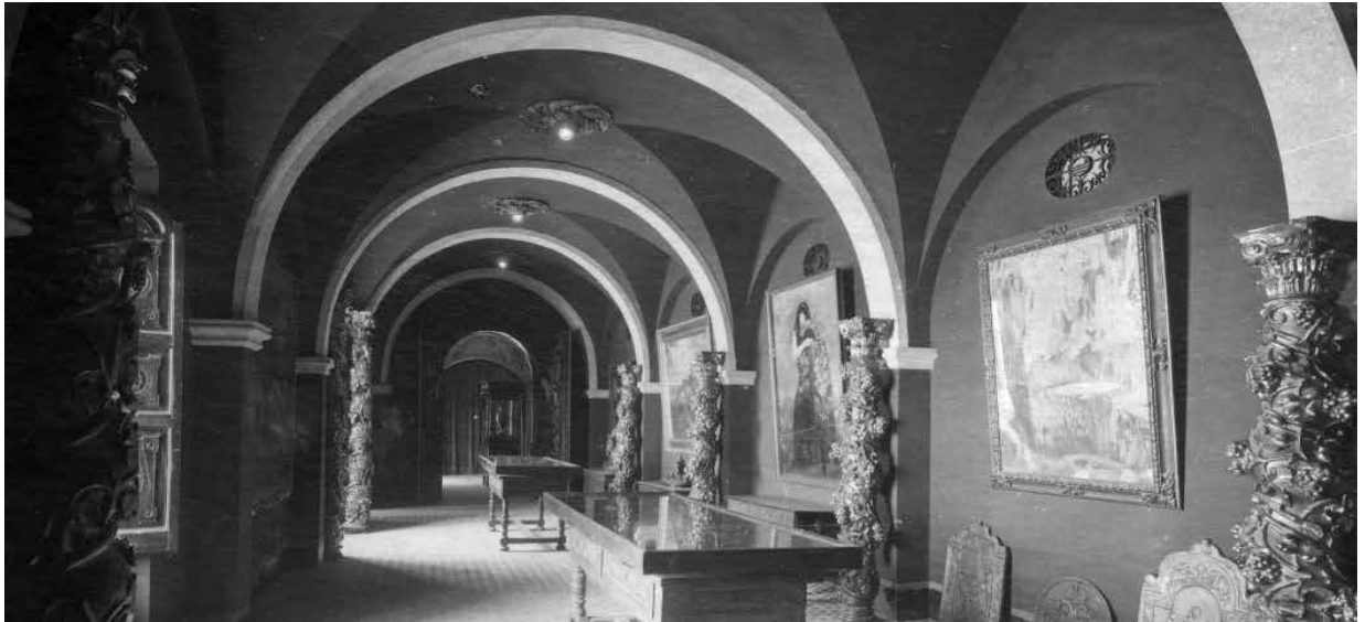
39. La Sala d'Art Modern. El segon quadre a la dreta, La de los ojos verdes , d'Hermen Anglada-Camarasa. Foto F. Serra (1918).

Destinat a comunicar la façana principal amb el vestíbul d'entrada per la porta de Raixa.