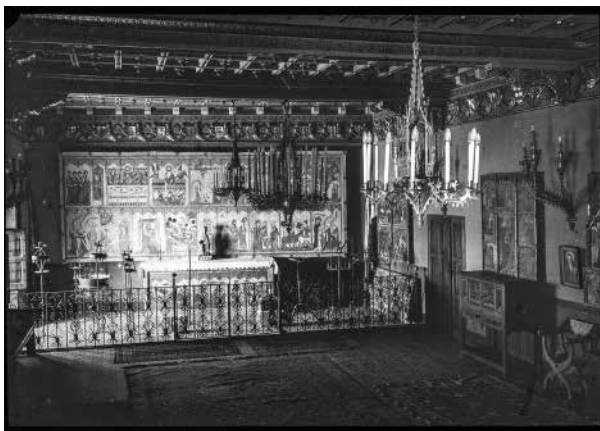
74. Sala dels Retaules, presidit per l'altar de Quejana. Foto F. Serra (1918).