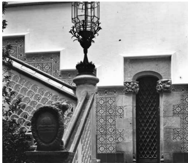
61. Escala principal, amb la porta de comunicació amb la casa d'Utrillo i els capitells procedents del santuari del Tallat. Foto F. Serra (1918).

Altres elements a destacar són un escut nobiliari procedent de Jaca, fixat entre l'enrajolat de la paret de baix del pati; dues portes petites al primer tram d'escala, procedents de Raixa (Mallorca), una de les quals comunica amb el que va ser el domicili de Miquel Utrillo, actual Biblioteca Popular Santiago Rusiñol, amb els capitells procedents del santuari del Tallat; els de l'altra porta són esculpits per Pere Jou. A manera de pom d'escala, llueix l'escut de Maricel mostrat per un lleó, del mateix escultor.