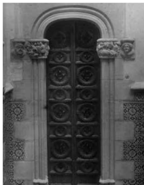
60. Porta vers la Sala dels Tapissos, amb els capitells de Pere Jou al·legòrics a la guerra i a la pau. Foto F. Serra (1918).

Altres elements a destacar són un escut nobiliari procedent de Jaca, fixat entre l'enrajolat de la paret de baix del pati; dues portes petites al primer tram d'escala, procedents de Raixa (Mallorca), una de les quals comunica amb el que va ser el domicili de Miquel Utrillo, actual Biblioteca Popular Santiago Rusiñol, amb els capitells procedents del santuari del Tallat; els de l'altra porta són esculpits per Pere Jou. A manera de pom d'escala, llueix l'escut de Maricel mostrat per un lleó, del mateix escultor.