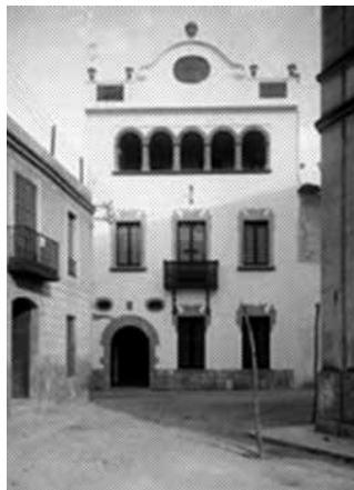
23. Façana de l'antiga casa de Miquel Utrillo (1914). Fotògraf desconegut (c. 1930).

Consta de tres edificis construïts entre 1915-1919, cadascun dels quals tenia accés directe amb el Palau de Maricel, en tant que dependències annexes amb entrada principal per la Plaça de l'Ajuntament.