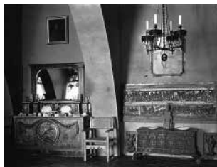
33. El pany de paret davant del Mirador combinava elements de mobiliari i decoració. Foto A. Mas (1912).

A mà dreta, els arcs es tancaven amb portes de vidre per aïllar l'interior del Mirador, que estava al descobert.