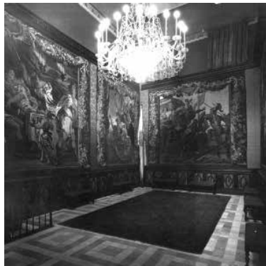
84. Sala dels Tapissos contigua a la casa de Miquel Utrillo. (1918).