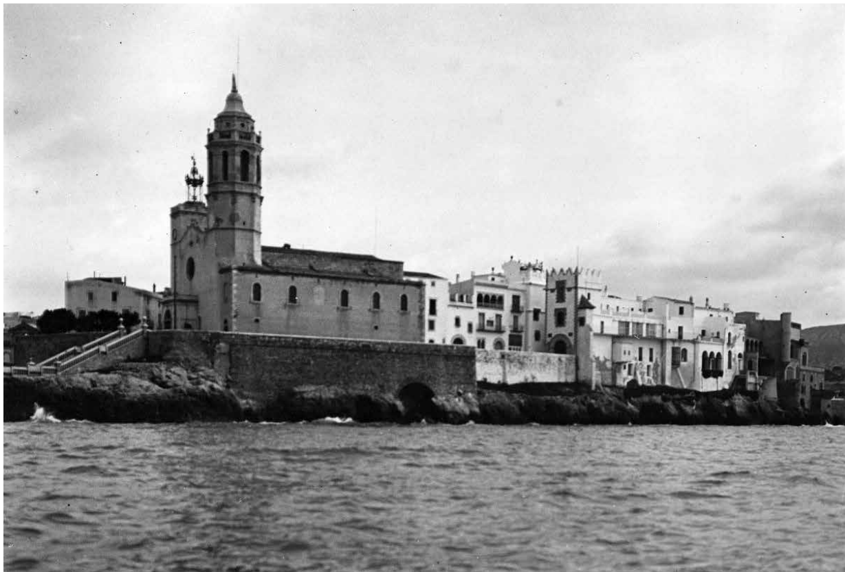
95. Vista de Maricel des del mar (1918-1920). Fotògraf desconegut.