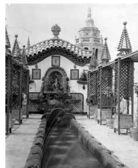
80. La terrassa central evocava el canal del Generalife. Foto F. Serra (1918).