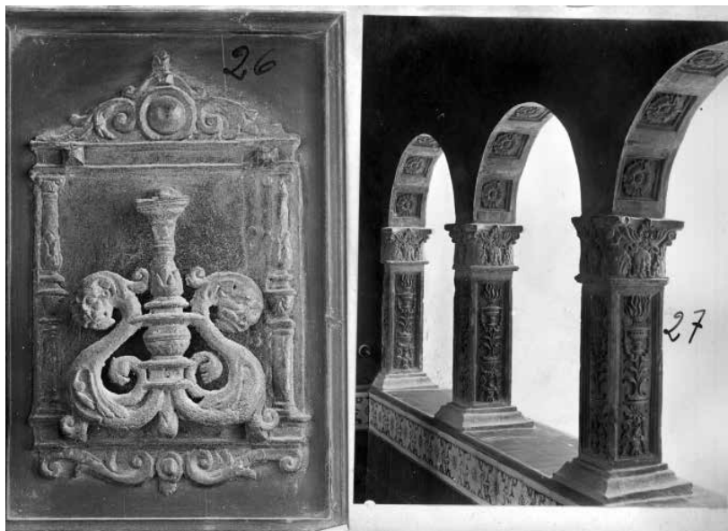
55. La rica decoració de terracota caracteritza els arcs del pont de Maricel. Foto F. Serra (1917).