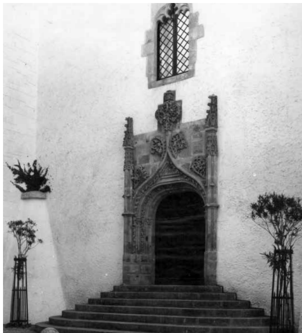
58. Tot i que la procedència de la porta és la població madrilenya de Cadalso de los Vidrios, des d'un primer moment va ser denominada Porta de Salamanca.