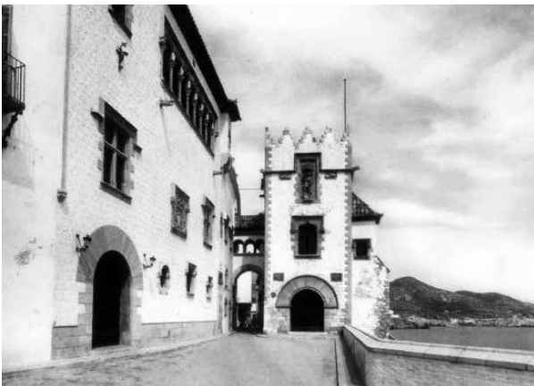
19. La Torre de Sant Miquel i la prolongació del Palau de Maricel tancant l'antic Baluard de Santa Caterina. (1918).