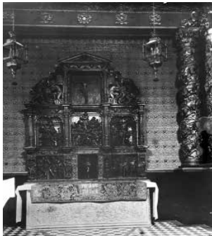
65. La Sala Capella (c. 1915).

La Sala Capella va canviar d'aspecte entre la seva primera instal·lació el 1915 i el 1921. El 1919, Deering hi va fer instal·lar un gran orgue –l'espai de la maquinària era considerable, al darrere i a sota de l'altar–, on alguns músics i compositors hi van interpretar diverses obres, com el compositor Déodat de Séverac el maig de 1920 i també Manuel de Falla. Deering va regalar l'orgue a la catedral de Tarragona en marxar de Sitges.