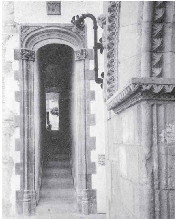
71. Targeta postal d'Angel T(olrà) V(jazo) amb l'entrada a la 5a Avinguda pel Baluard de Santa Caterina (1914).

Al frontal del davant de la Torre de Sant Miquel, Utrillo hi va encastar un escut de Sitges del segle XVII.