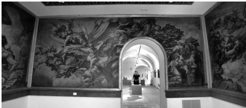
41. Vista actual de la Sala Sert.

El 1911 aquest portal d'entrada complia funcions de garatge, a tenor d'algunes fotografies que mostren el cotxe de Mr. Deering en disposició d'entrar-hi; en aquells moments, l'entrada i el vestíbul principal eren per la porta lateral.