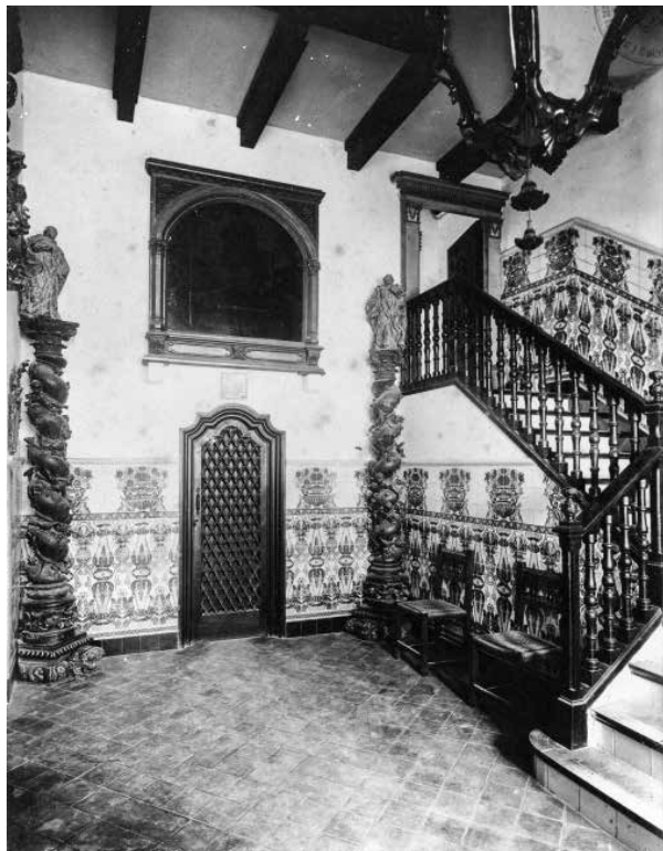
42. El vestíbul d'entrada per la porta de Raixa. Foto F. Serra (1918).

Al defora, hi va instal·lar una porta de pedra amb la llinda d'estil renaixentista procedent dels jardins de Raixa (Mallorca).