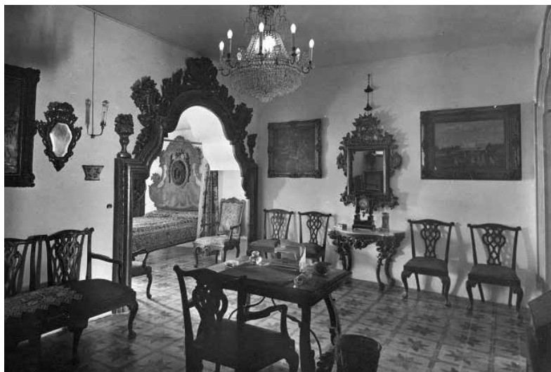
46. Habitació de Mrs. Deering. En primer terme, Versalles, de Joaquim Sunyer (1905).

Utrillo va fer construir diverses cambres de bany a la residència de Deering, alguna de les quals és visible en fotografies. També cal observar les rajoles del paviment, moltes d'elles de construcció hidràulica.