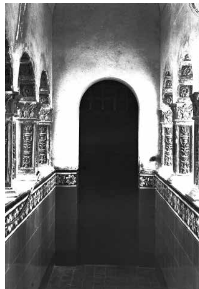
56. Interior del pont de Maricel, amb les parets de rajoles de ceràmica i els arcs revestits de terracota. (1918).