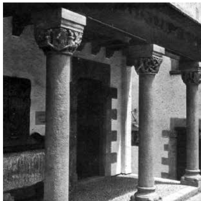
27. Porxo d'entrada a l'edifici del Sarcòfag. Foto F. Serra (1918).