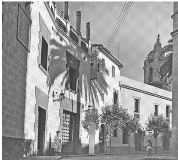
91. El garatge de Maricel, comunicat internament amb diverses dependències del Palau, va ser la darrera edificació del complex. Fotògraf desconegut (c. 1920).

El garatge de Maricel tenia l'entrada per la Plaça de l'Ajuntament i comunicava interiorment amb altres dependències interiors. Actualment, manté l'estructura exterior intacta, fins i tot la porta de fusta plegable amb claus de forja, com totes les altres portes exteriors del conjunt.