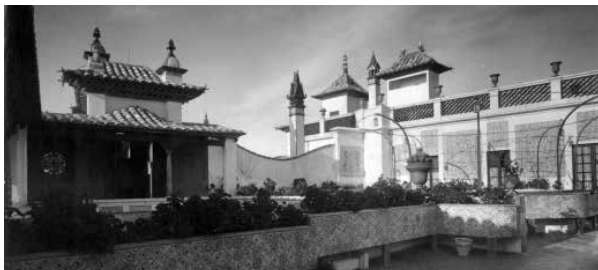
21. Vista lateral de les Terrasses de Maricel. Foto F. Serra (1918).