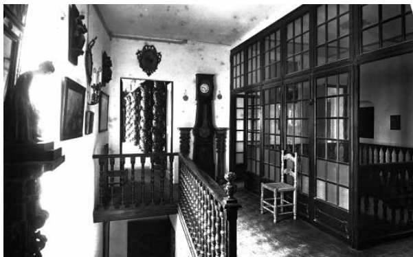
43. Distribuïdor del primer pis, cap a l'ala esquerra, cap a l'estudi i habitació de Mr. Deering. Foto F. Serra (1918).

El distribuïdor de la primera planta, conservat actualment amb la mateixa funció, dividia les dependències de Charles Deering i les habitacions de la seva família i convidats.