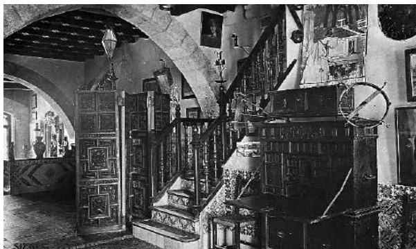
6. Targeta postal Sitges. Lo Cau Ferrat, propietat de Santiago Rusiñol. Rebedor.

El setembre de 1909 Charles Deering, Ramon Casas i Miquel Utrillo dinaven al Cau Ferrat, convidats per Santiago Rusiñol (Barcelona, 1861- Aranjuez, 1931), envoltats de la seva col·lecció d'art a la seva casa-taller.