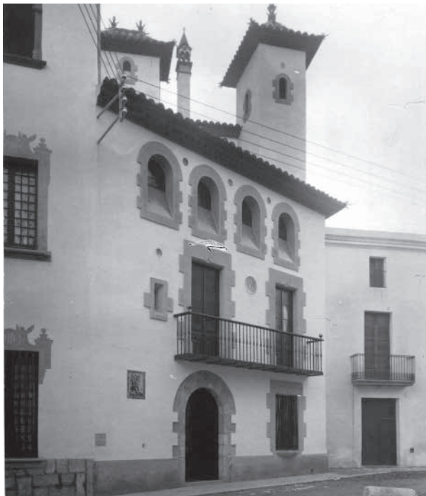
24. Façana de la casa de Pelegrina Vidal, pertanyent al complex de Maricel (1916). Foto F. Serra (1918).