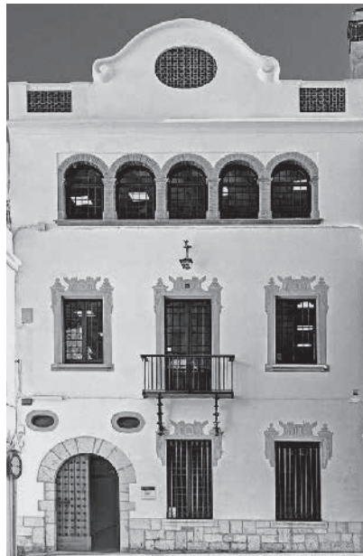
89. Façana de la casa d'Utrillo dins del complex de Maricel (1914). Foto Josep Maria Alegre (2015).

Construïda al sector oposat, però intercomunicada per l'interior amb el Palau, és on Utrillo s'instal·là amb la seva família per tal de tenir cura de Maricel. El 1936 va ser convertida en la primera biblioteca pública de Sitges, la Biblioteca Popular Santiago Rusiñol. De la construcció original destaca la gran porta de fusta, el terra de rajola hidràulica i el pati de ceràmica blava amb el brollador, les heures que envolten les columnes i les plantes, un dels més bonics interiors de Sitges. Destaca també la façana, amb esgrafiats al més pur estil noucentista, on figura l'any de la construcció i les inicials de Miquel Utrillo en la forma del monograma que utilitzava.