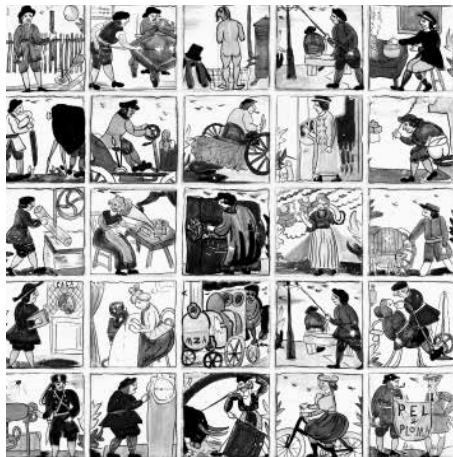
51. “Els adelantos del segle XIX”, obra de Ramon Casas (1901-1902).

Al Museu de Maricel, actualment, es mostra el plafó de rajoles d'“Els adelantos del segle XIX”, obra de Ramon Casas, que havia format part de l'antiga col·lecció de Maricel. Era una sèrie col·leccionable editada per la revista Pèl & Ploma (1899-1903), la publicació més prestigiosa del Modernisme, pagada per Casas i escrita i dirigida per Utrillo. Elaborades amb traç arcaïtzant i llenguatge irònic per Casas, cadascuna descriu un dels grans avenços del segle en els àmbits de la vida pública (la llum de gas, el tren, el guardaagulles, el telègraf, el telèfon,...) i privada (la màquina de cosir, la dutxa, el vàter, la bicicleta, l'automòbil,...).