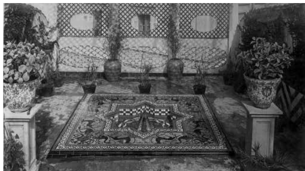
78. La terrassa contigua al Claustre, amb la font de Daniel Zuloaga Boneta. (1917).

Les Terrasses van ser embellides amb peces i plafons de ceràmica a les teulades i parets, i amb escultures de terracota situades entre les fonts, a la terrassa de la casa de Miquel Utrillo. Es van col·locar jardineres de ceràmica amb enrajolats antics.