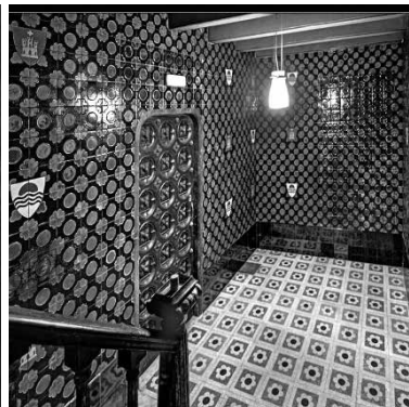
85. Entrada a les sales dels Tapissos pel portal del Racó de la Calma (1916-1917).

El 1916 es va nlllestrir l'ala del Sarcòfag, coneguda amb aquest nom pel sarcòfag paleocristià del segle IV trobat a les excavacions vora de l'ermita del Vinyet, per mostrar la col·lecció de tapissos.