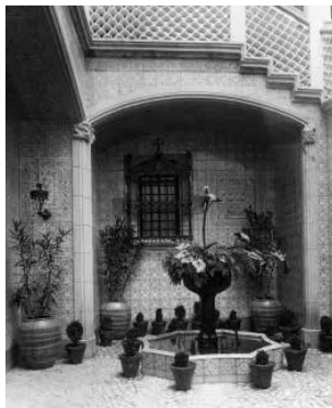
59. El sortidor del pati d'entrada del Palau de Maricel, cobert d'heura i envoltat de plantes des dels seus primers dies.