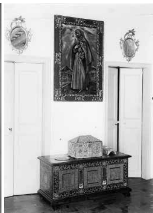
53. Sant Francesc , d'El Greco, en una de les dependències de la residència Deering. Foto F. Serra (1918).

La segona planta estava configurada per un seguit de dependències i habitacions, on les obres d'art cobrien les parets i el mobiliari antic predominava.