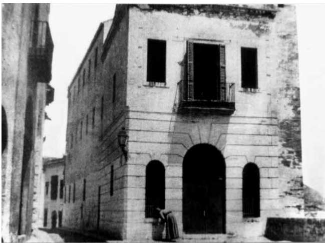
3. Vista de l'antic Hospital de Sant Joan Baptista, amb el Cau Ferrat al fons (c. 1900).

L'antic Hospital de Sitges, dedicat a Sant Joan Baptista, va ser edificat al segle XIV al nucli del Puig de Sitges, vora el castell i l'església parroquial, i donà el nom al barri que es va edificar al seu voltant. L'hospital és esmentat al testament del senyor feudal de la Vila, Bernat de Fonollar, el 1324.