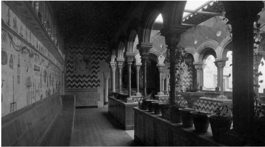
76. Claustre de Maricel, amb el conjunt de rajoles del segle XVIII.

Utrillo va resoldre amb habilitat el pas del Claustre a les Terrasses de l'altre cos d'edifici, aconseguint que tot Maricel es comunicués a través dels diversos nivells per les terrasses i, des d'aquestes, es facilités l'accés a l'interior del complex.