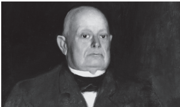
86. Retrat del senyor Panxo Xicarrons, obra de Santiago Rusiñol (1895, Museu del Cau Ferrat).