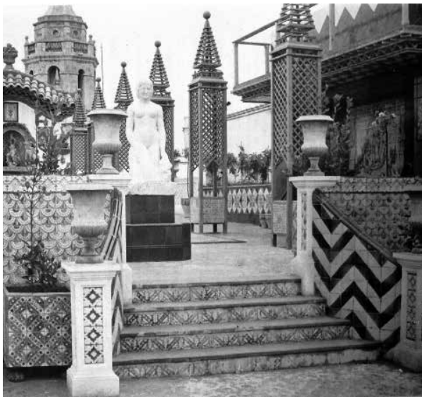
81. Escultura de Josep Clarà encarregada expressament per a la terrassa central. (1918).