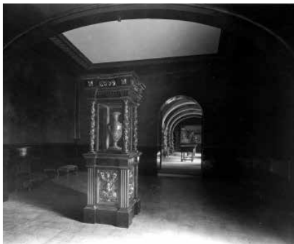
40. La Sala Sert amb la seva decoració inicial (1916-1918).