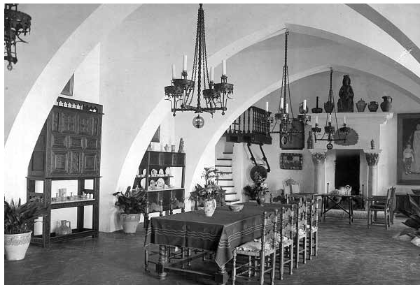
32. El primer menjador de Maricel, amb obres de Ramon Casas a banda i banda de la xemeneia.