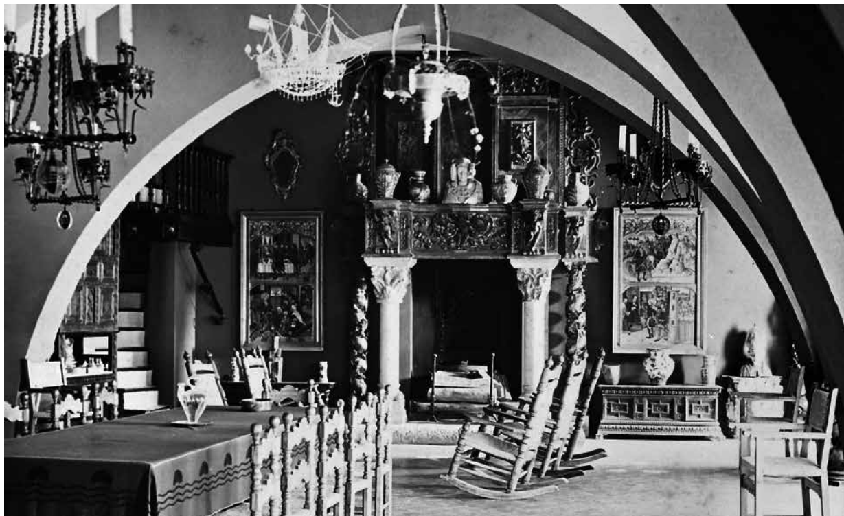
31. Menjador gran, amb una rica decoració de taules gòtiques i objectes artístics. Foto A. Mas (1914).

(ANTIGA CAPELLA DE L'HOSPITAL DE SANT JOAN BAPTISTA O SALA GÒTICA)