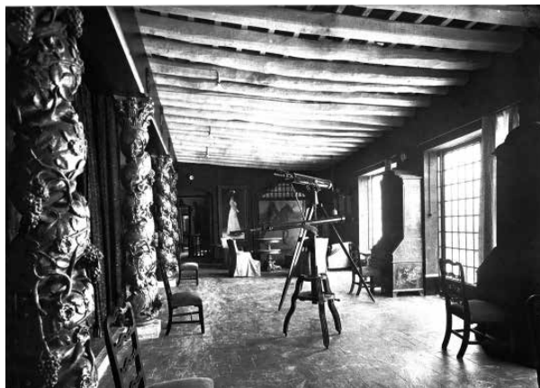
48. Estudi de Charles Deering amb la incorporació de la biblioteca sostinguda per columnes salomòniques. (1918).

Entre 1910 i 1914, l'aparença de l'estança era més simple. Al fons destacava la taula de treball de Deering i un dels retrats que va pintar Casas; en una altra imatge, a l'altre angle, més obres de Casas: Júlia vestida de blanc (1910) i el Retrat equestre del rei Alfons XIII (1904).