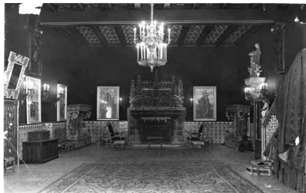
63. Gran Saló, amb les parets envoltades per retaules gòtics.