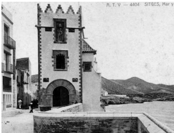
29. Targeta postal d'Angel T(olrà) V(iazo) mostrant la Torre de Sant Miquel ja enllestida, abans de la construcció del pont (1914).

La Torre de Sant Miquel, edificada el 1914, culmina la transformació de l'antic hospital i atorga a l'edifici l'aspecte monumental que conserva fins l'actualitat. La reforma de la façana anivella l'alçada de l'edifici i mostra un elegant acabament en forma de torre amb els merlets que li atorguen un aspecte distingit, ennoblit per l'escultura afegida a la façana. Es tracta de l'escultura gòtica representant Sant Miquel, provinent del cap de pont de la ciutat de Balaguer. En un nivell més baix, a banda i banda, s'hi incrusten els escuts d'armes dels comtes d'Urgell. El portal existent va ser substituït per una porta adovellada procedent d'Andorra.