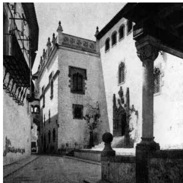
26. La Placeta de Sant Joan es va denominar un temps Placeta de Maricel. (c. 1918).

La denominació de Racó de la Calma li va ser atorgada l'any 1932, a proposta de Miquel Utrillo.