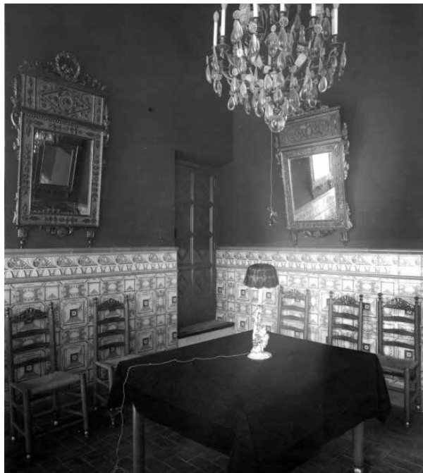
36. El menjador petit quedava situat a l'altra banda del Mirador. Foto F. Serra (1918).

Ocupava l'espai final del Mirador, en direcció al passadís de l'art modern. Assolellat i íntim, va ser decorat ricament tant pel que fa a mobiliari com a làmpares i miralls.