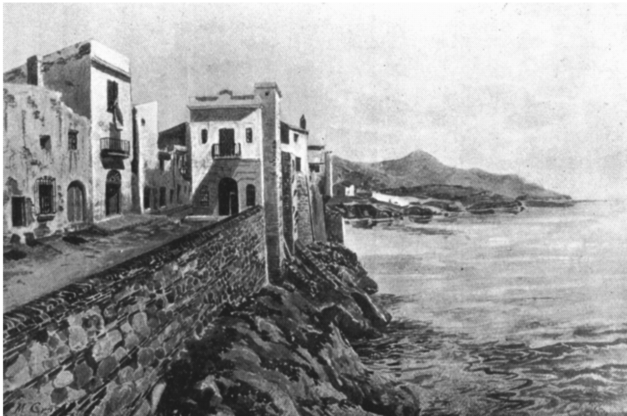
2. L'antic Hospital de Sitges , de J. Crusat (c. 1900).