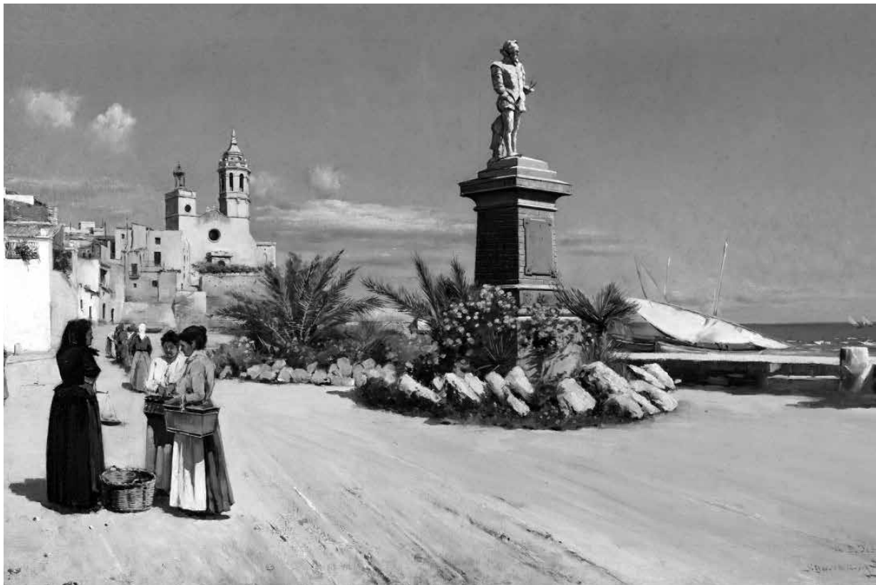
1. Vista de la Ribera i el Greco , de Joaquim de Miró (1908, Museu de Maricel). La primera imatge de Sitges que va veure Charles Deering.