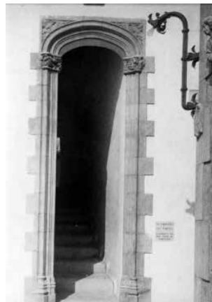
20. L'entrada a la 5a Avinguda pel Baluard de Santa Caterina, actualment Baluard Miquel Utrillo. (1918).