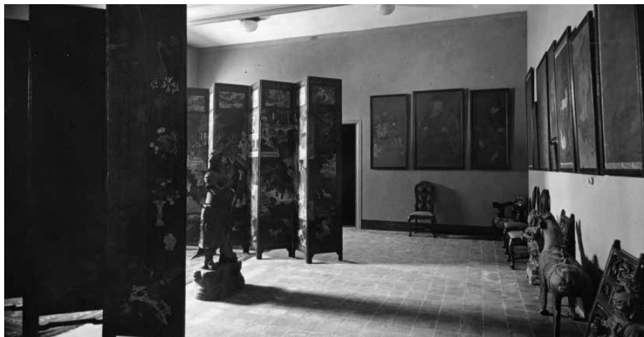
73. La col·lecció d'art xinès a la sala de la planta baixa de Maricel, amb entrada pel Baluard de Santa Caterina.