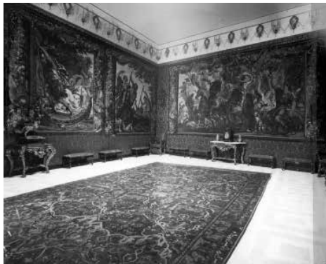
83. Sala gran dels Tapissos. (1918).