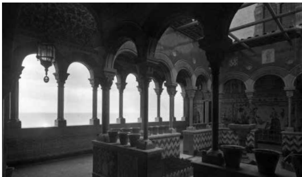
22. El Claustre de Maricel, mirant a mar. Foto F. Serra (1918).