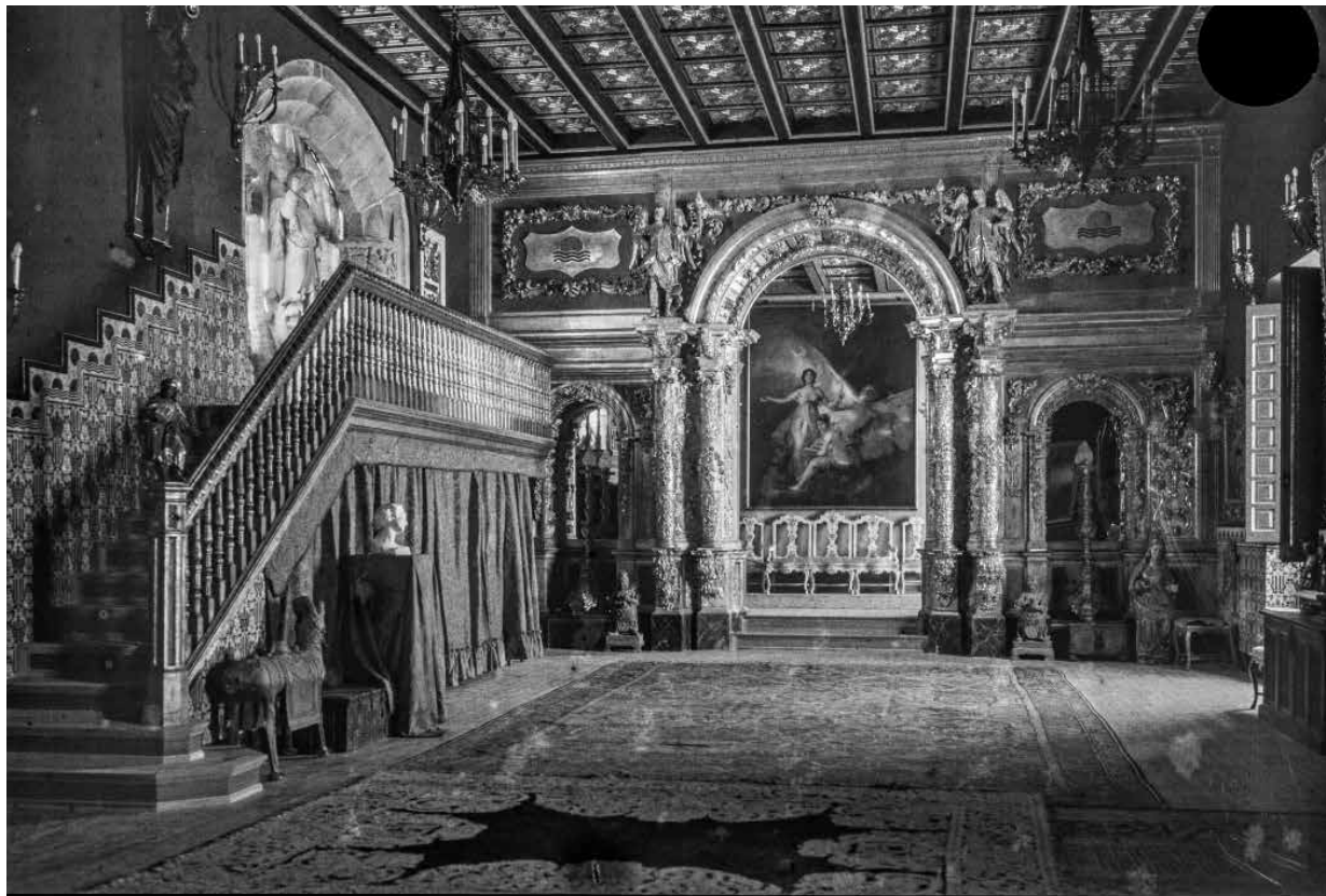
64. Vista del Gran Saló orientada al vestíbul, on s'observa l' Al·legoria del Temps i la Història , de Francisco de Goya. Foto F. Serra (1918).